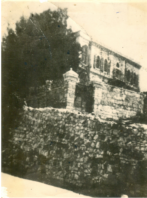
איור 3: וילה סאלם בתקופת המנדט

הסמוכה, אך הדרך לבית לחם הייתה קשה. הבידוד של העיר בית לחם הוסיף לתחושת הבידוד של האסירות והעצירות היהודיות, וניתק כמעט כליל את האפשרות להמשיך בפעילות מחתרתית מבין כותלי הכלא.