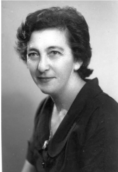
איור 2: צילה עמידרור

ראוי לציין כי לאחר המעצרים ההמוניים של השבת השחורה (יוני 1946) הובאו נשים גם לאגף מיוחד שנפתח עבורן במחנה המעצר בלטרון – לטרון ג'. לאחר זמן מה שוחררו חלק מהנשים, ואילו האחרות הועברו לבית לחם (משגב 2008: 17-18).