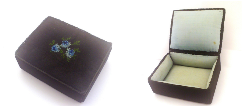
איור 7: קופסת תכשיטים שהוכנה על ידי לאה וולץ בכלא בית לחם

החבאת מכתבים בעבודות היצירה היא עדות נוספת לסולידריות בין הנשים בכלא, כיוון שאי אפשר להעלים זאת מסוהרות הכלא ללא הסכמה הדדית ושיתוף פעולה מלא בין האסירות והעצירות. לעיתים מזדמנות בוצעו חיפושים על ידי השוטרות בעבודת האומנות, ועל כן הכינו האסירות שתי עבודות זהות. את הראשונה, ללא המכתב המוסתר, שלחו לביקורות. לאחר שזו אושרה הוחלפה העבודה בעבודה זהה, ובה הוחבא הפתק (עמידור 1961: 96-97). המשפחה או אנשי המחותרת שאליהם נשלחו העבודות ידעו לחפש בהן את התכתובת הסודית. אפשר לשער כי חלופת מכתבים באופן זה, נוסף על היותה קשר נוסף עם העולם שבחוץ, שמרה אצל האסירות על תחושת שותפות במאבק המחותרתי בבריטים, אף בהיותן מאחורי סוגר ובריח.