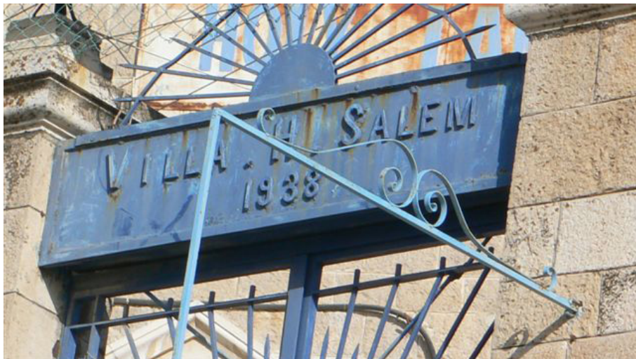
איור 6: שער וילה סאלם

הביקור בכלא בית לחם דרש היערכות של המבקרים, והם חויבו להנפיק רישיון כחודש לפני הביקור. 38 כבכל מחנה מעצר, גם בבית לחם הותקן שטח לקבלת ביקורים. ואולם, מעדויות של אסירות ועצירות נראה כי מחסה זה לא הגן על המבקרים, שלעיתים נאלצו לחכות במשך שעות ארוכות במזג אוויר קיצוני של גשם, קור או חום. העובדה כי הכלא היה מרוחק מיישוב יהודי ושכן בלב עיר ערבית הערימה קשיים על חלק מהמשפחות שרצו