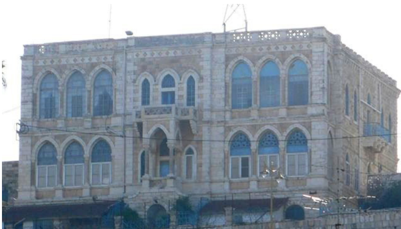
איור 1: וילה סאלם בראשית המאה ה־21

בבית מאסר זה בילו במשך חודשים רבים אסירות ועצירות ערביות ויהודיות. מן הנתונים השמורים במוזיאון אסירי המחותרות בירושלים אנו מזהים בשמן כמאתיים אסירות ועצירות יהודיות שהיו כלואות בבית לחם מתחילת שנות ה־30 ועד לפירוק הכלא בשנת 1947. רובן הגדול השתייכו באופן מובהק למחותרות הפורשים – אצ"ל ולח"י – ונאסרו עקב השתייכותן למחותרות אלה. לצידן היו כלואות בתקופה זו שמונה נשים חברות ההגנה, חברת פלמ"ח אחת, 2 וגם הזמרת הנודעת הילדה דולציקה, שנכלאה בגיל 56 למשך כחודש בעקבות "הלשנה מחוסרת יסוד, כדי לנקום בזמרת", כלשון העיתון על המשמר. 3