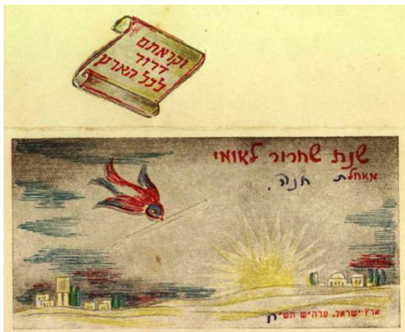
איור 9: כרטיס שנה טובה מכלא בית לחם

אסירות ועצירות בית לחם נאלצו להתמודד עם קשיים פיזיים ונפשיים בעקבות אובדן חירותן, כפי שהוצג לעיל. יחד עם זאת, להתמודדותן נוספו קשיים ייחודיים לנשים, כמו התמודדות עם היריון בין כותלי בית הסוהר, הפגדה מהילדים ועוד. על אף הקשיים הפיזיים, ואולי דווקא בגללם, פיתחו האסירות והעצירות חיי חברה ורוח עשירים. בתוך המשבר הגדול הן יצרו קהילה נשית תומכת ומעודדת, שהייתה מעין תחליף למשפחה. פיתוח חיי הרוח עזר בשמירה על נורמליזציה של חיי יום-יום ככל האפשר ובעידוד רוחן של האסירות והעצירות. אולי לכך כיוון בגין שכינה את גבורתן – 'גבורה שקטה'.