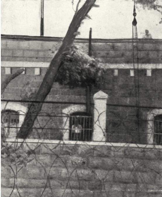
איור 4: אסירה בחלון כלא בית לחם – וילה סאלם

ומשמעויות חדשות (להרחבה ראו חן ועינת 2010: 63–64). כחלק מפעולות הקליטה אפשר להצביע גם על פעולות של השפלה ואיבוד הסטטוס האישי, שכללו תהליך פרידה של האסיר והאסירה מהעולם החיצון וממקורביהם. כמו כן, אפשר לבחון תהליכים המכונים על ידי חוקרי מדעי החברה 'תהליכי חשיפה' לחיי הכלא. ביניהם חשיפה של האסיר או האסירה למעמדם החדש, תהליך המתעצם לאור לקיחת הציוד האישי שלהם וכן לבישת מדי אסיר (אוברגוט-שליו 2001: 8).